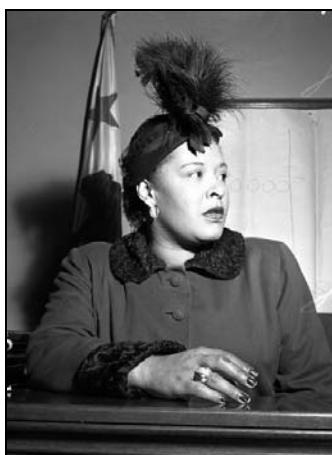
Figura 5 – Adorno de cabeça feminino em Billie Holiday 13

Os adornos, ou casquetes, voltam às ruas e passarelas reformulados, contudo sem perder o referencial identitário dos “anos loucos” e das divas do jazz , conforme observamos nas imagens a seguir.