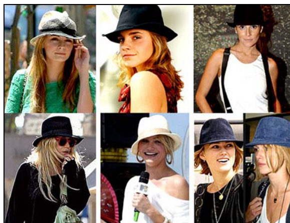
Figura 4 – Chapéus usados na atualidade 12

Na atualidade, o chapéu é usado tanto por homens quanto por mulheres, trazendo um estilo singular para quem o usa e podendo ser colocado com roupas de festa ou com jeans e camiseta, tornando-se um signo de diferenciação as mulheres de hoje.