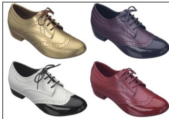
Figura 8 – Sapato Melissa, releitura atual 16

Como se pode verificar em alguns modelos atuais de sapatos, o que estava em voga nos anos 20 é encontrado em revistas e catálogos de moda, com o acréscimo de requinte e conforto para os pés.