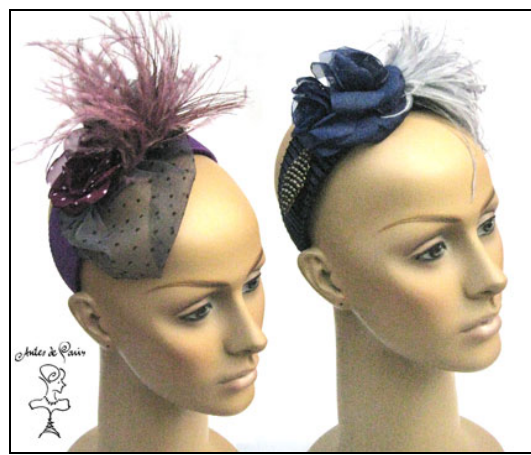
Figura 6 – Adornos usados atualmente 14