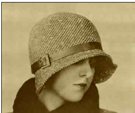
Figura 3 – Chapéu feminino 11