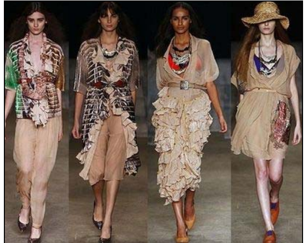
Figura 10 – Tonalidades neutras na passarela inspiradas na década de 20 18

Essas tonalidades neutras podem ser encontradas na moda atual, conforme podemos observar no desfile da coleção verão 2010 da marca Coven, que se inspirou na década de 20.