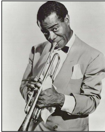
Figura 1 – Traje completo de Louis Armstrong 9