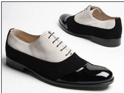
Figura 7 – Sapato masculino dos anos 20 15

Nesse contexto, os pés tornam-se o foco da moda e o ritmo do Charleston influenciou diretamente os calçados, pois a dança exigia um calçado com boa estabilidade, sendo ele fechado e seu salto baixo (DORFLES, 1984).